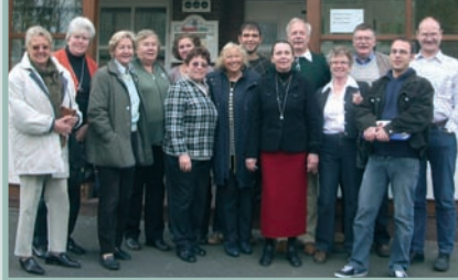
Gruppenbild mit Kirchenvorstand, Klausurtagung 2008